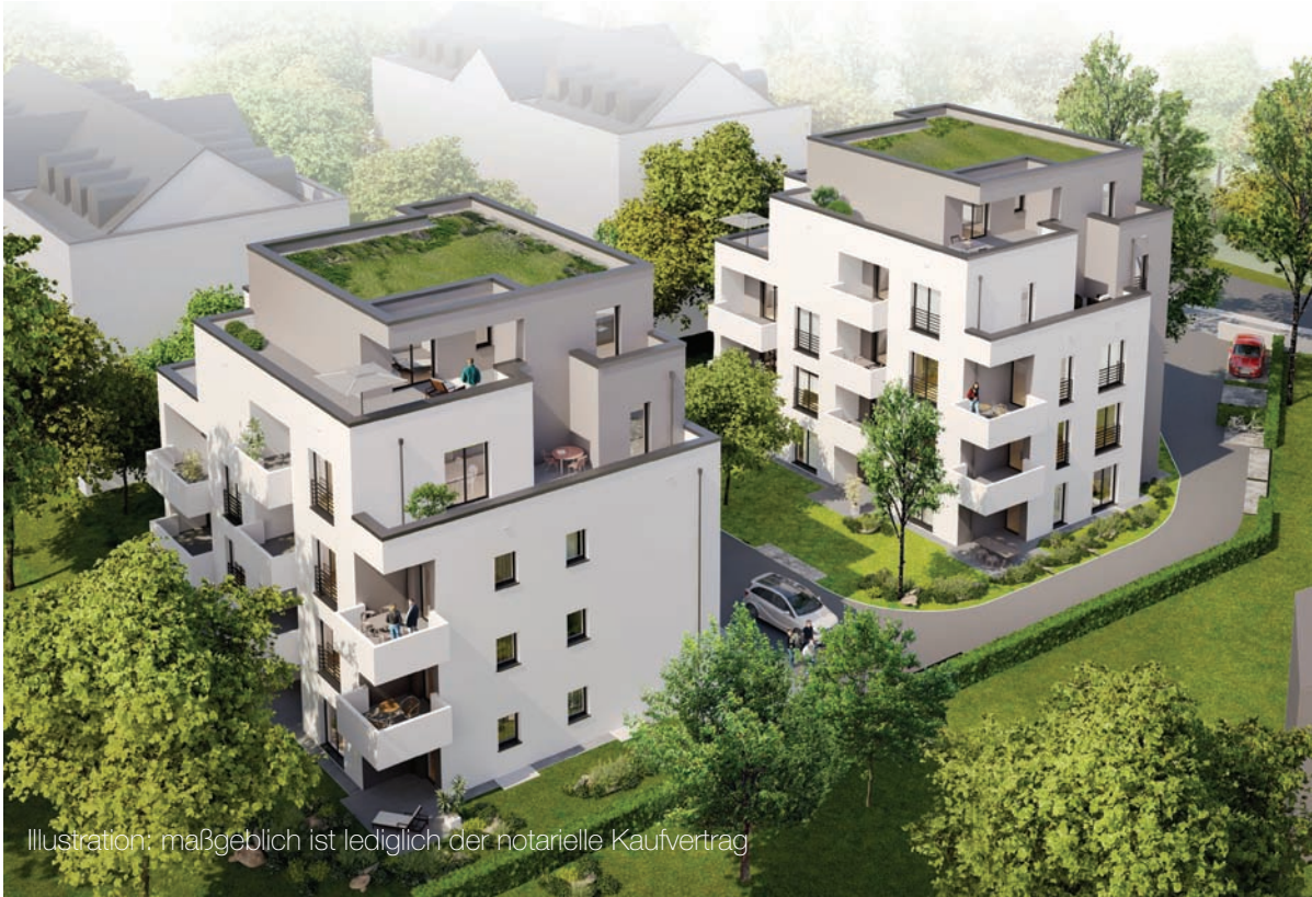
Illustration: maßgeblich ist lediglich der notarielle Kaufvertrag