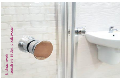
Musterbild – kein Objektbild