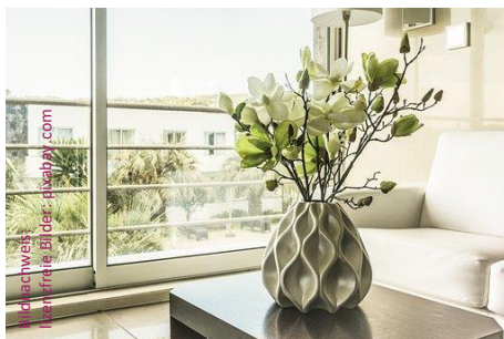
Musterbild – kein Objektbild